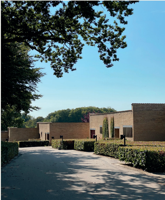
TEGNET AF JØRN UTZON

Besøg unik arkitektur midt i Nordsjælland